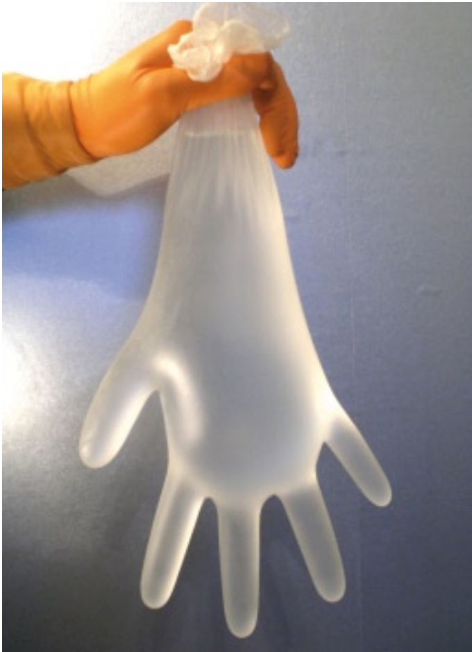
Abb. 1: Vinyl-HS mit 1.000 ml Wasser gefüllt – gemäß EN455-1:2000 – „AQL-Test“.

Standards sind auf diese Eigenschaften aufgebaut. Interessanterweise wird in diesen Standards auf die schlechteren Werte in Reißfestigkeit und Dehnbarkeit bei Vinyl HS Rücksicht genommen. Das bedeutet: Der weit schlechteren Strapazierfähigkeit wird Rechnung getragen, indem man die Anforderungen für Vinyl HS im Test und in der Norm herunter setzt. Tabelle 2 zeigt dies für die Anforderungen an Untersuchungshandschuhe von der American Society for Testing and Materials.