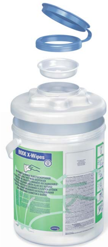
3-teiliges Deckelsystem sowie Spendergehäuse für einfache und sichere Aufbereitung