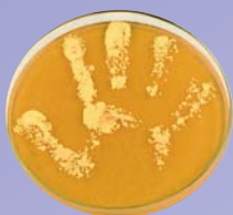
Handabklatsch ohne Seifenwaschung oder Desinfektion

Mit ihrer „Clean Care is Safer Care“-Initiative startete die WHO 2005 eine weltweite Kampagne für mehr Patientensicherheit. Im Mittelpunkt steht die Verbesserung der Händedesinfektion, da diese einen direkten Einfluss auf die Übertragung pathogener Erreger hat. Für dieses Ziel wurde das Konzept der „5 Momente der Händedesinfektion“ entwickelt (1).